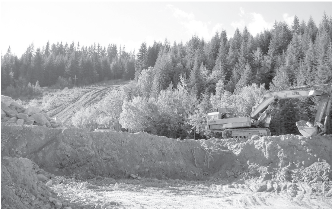
Въпреки многобройните граждански протести багерите продължават да разкъсват недрата на Рила.

През 2004-а дяловете на двете фирми в „Атомик инвест“ се изкупуват от „Рила спорт“, която се наема да осигури инвестициите, а общината - да набави необходимите документи. Тя подава молба за промяна на строежа, но МОСВ одобрява само Горната въжена станция. За останалата част от лифта