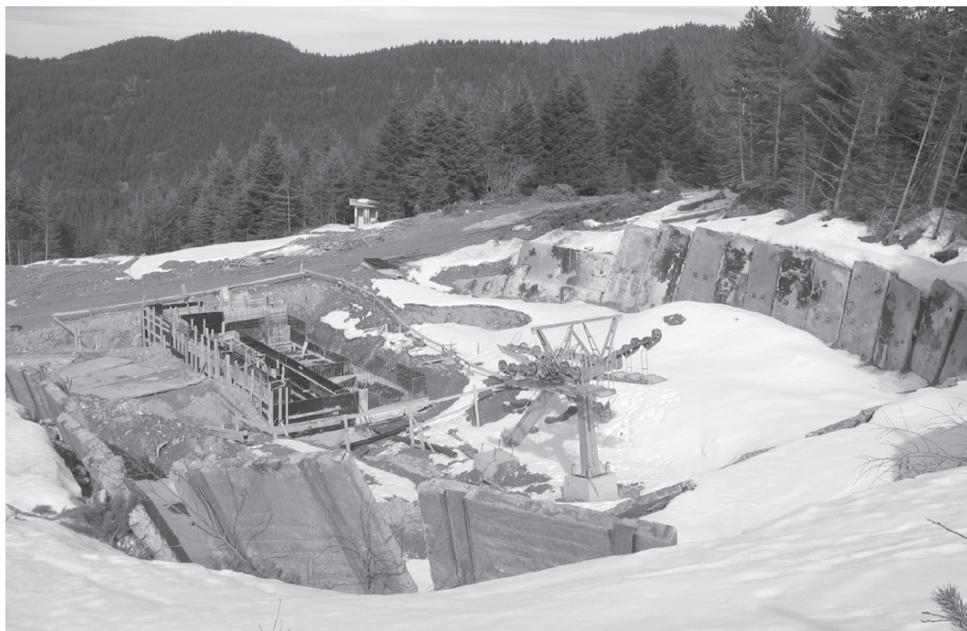
Евентуалното изграждане на ски курорт ще „обезобрази“ местността „Паничище“ по подобие на ски курортите в Пирин.

няма издадено разрешение за промяна на строежа, въпреки че стълбовете вече са изградени и на места са паралелно разположени със старите. При всичките наложени актове от екоминистерството за административни нарушения на възложителя и строителя и при множеството протести на природозащитници и граждани до ден днешен нито една институция не е изискала спирането на градежа. Интересно е също как законово ще се довърши той, при положение че разрешително има само за част от лифта. На всичко отгоре запознати изтъкват, че новият лифт ще е доста по-различен от стария. Старият е трябвало да бъде двуседалков, а за новия се предполага,